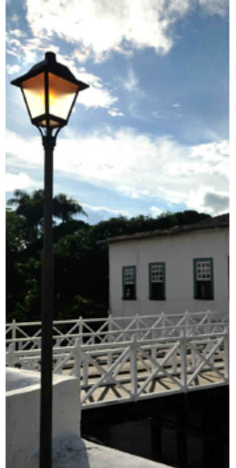
Casa de Cora: local é ponto turístico da Cidade de Goiás

Conhecidas pelo charme barroco, Cidade de Goiás e Pirenópolis são destinos turísticos procurados por goianos para passar a virada. DM explica o que você deve ter em mente ao escolher o lugar em que irá ficar