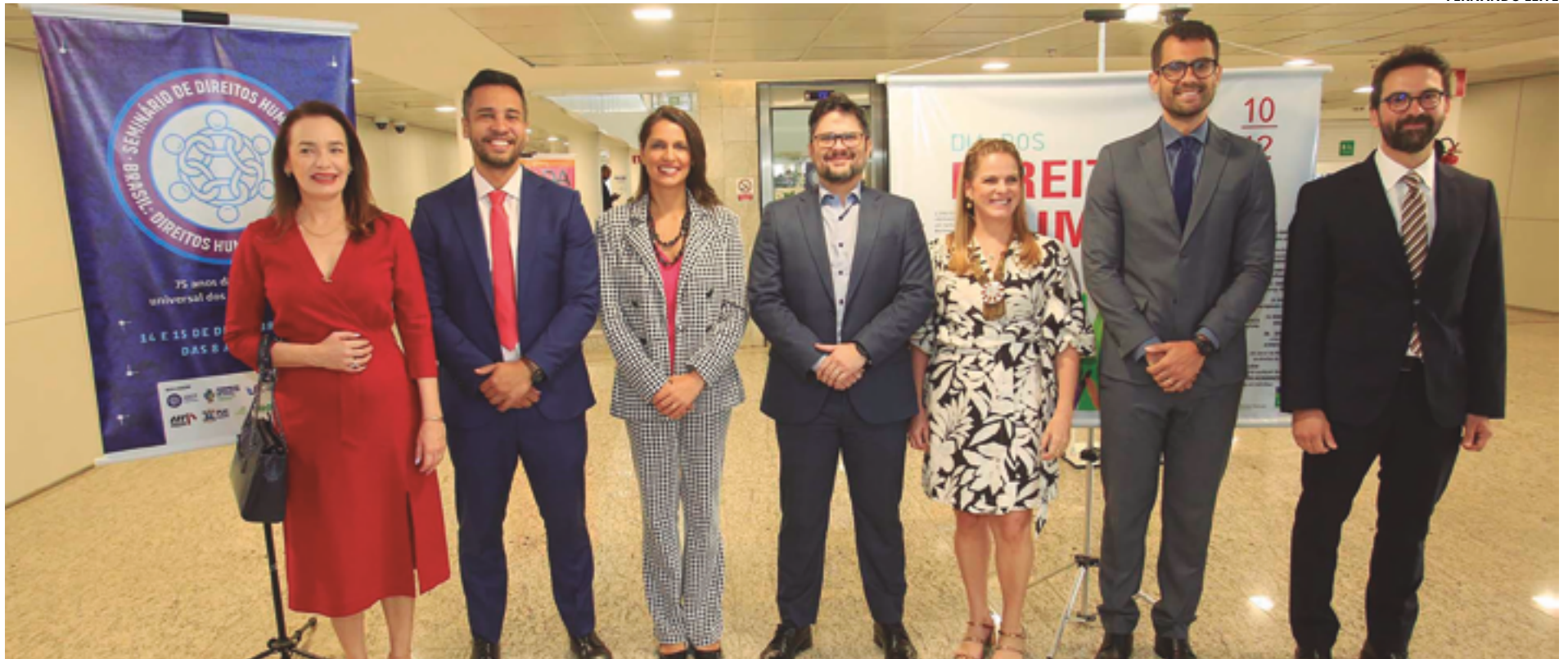
Promotores do Ministério Público do Estado de Goiás debateram direitos humanos nas áreas criminal, saúde, educação, criança e adolescente, terceiro setor, políticas sociais, entre outros