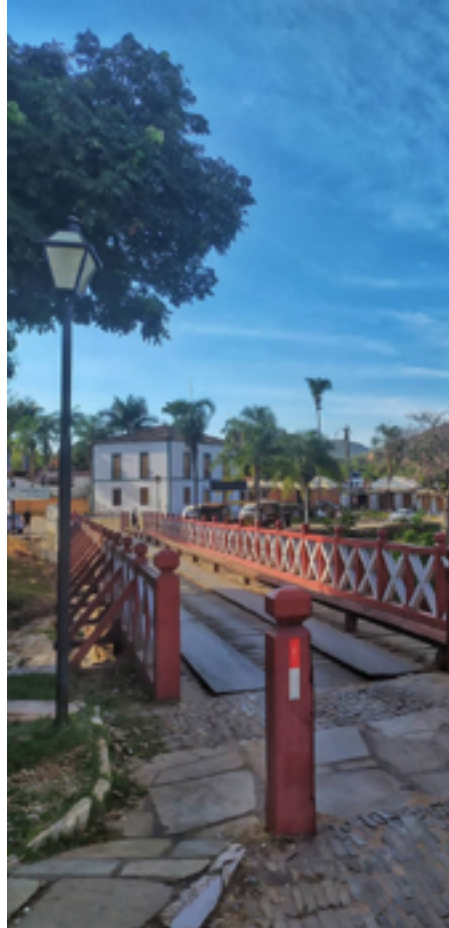
Coração de Piri: movimentada vida boêmia, gastronômica e cultural