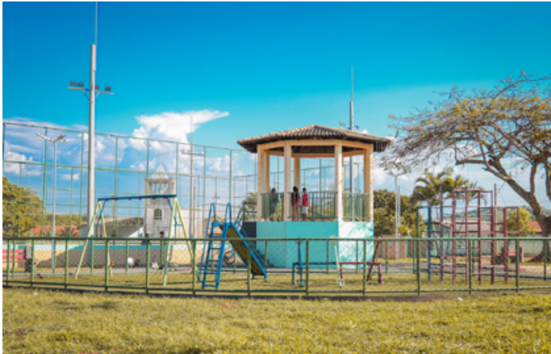
Em 2023, oito “esqueletos” como a praça do Coreto, ganharam forma e se transformaram em serviços para a população, destaca a gestão