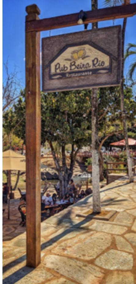
Pub à beira do Rio: point das biritas e da gastronomia