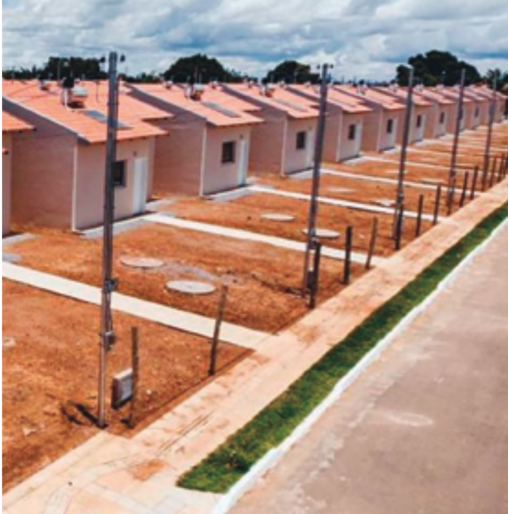
Cidade tem projetos de habitação no Plano de Aceleração do Crescimento