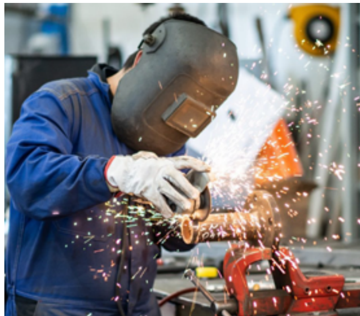
PIB goiano cresce mais de 5% no terceiro trimestre de 2023: economia de Goiás superou resultado nacional, que ficou em 2%

Com os resultados da indústria de transformação (4,1%), a atividade industrial encerrou o trimestre com taxa positiva de 2%. Por sua vez, a indústria extrativa, construção civil e serviços industriais de utilidade pública encerraram o trimestre com taxas de -9,9%, -3,3% e -1,6%, respectivamente.