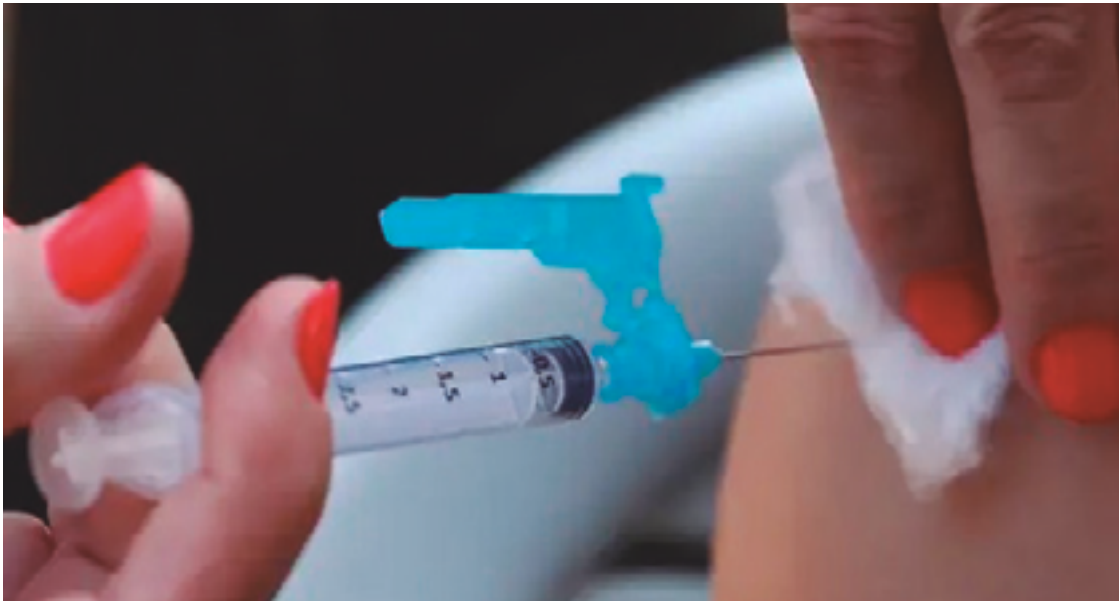
Produzida pelo laboratório Takeda, do Japão, a vacina protege, principalmente, contra formas graves da doença