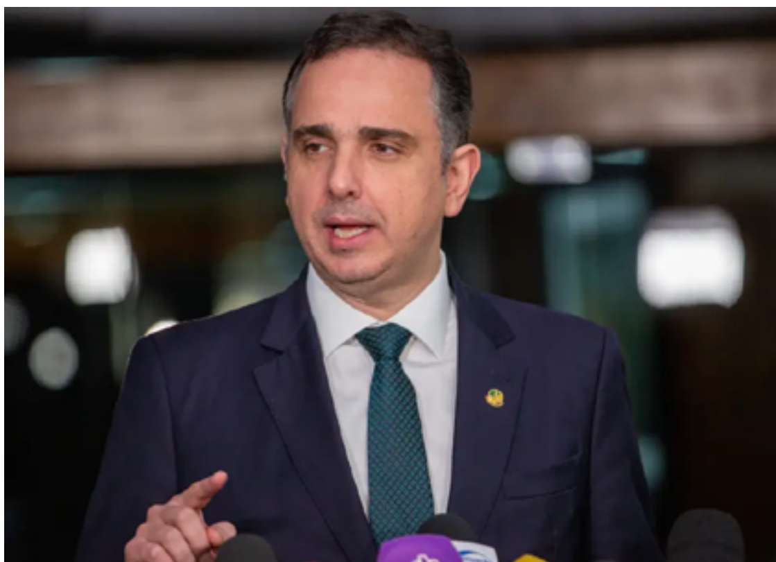
Rodrigo Pacheco: fundão eleitoral tira dinheiro da educação, saúde e infraestrutura do país

Segundo Pacheco, “as pessoas não compreenderão” o novo valor do fundo. Na ava-