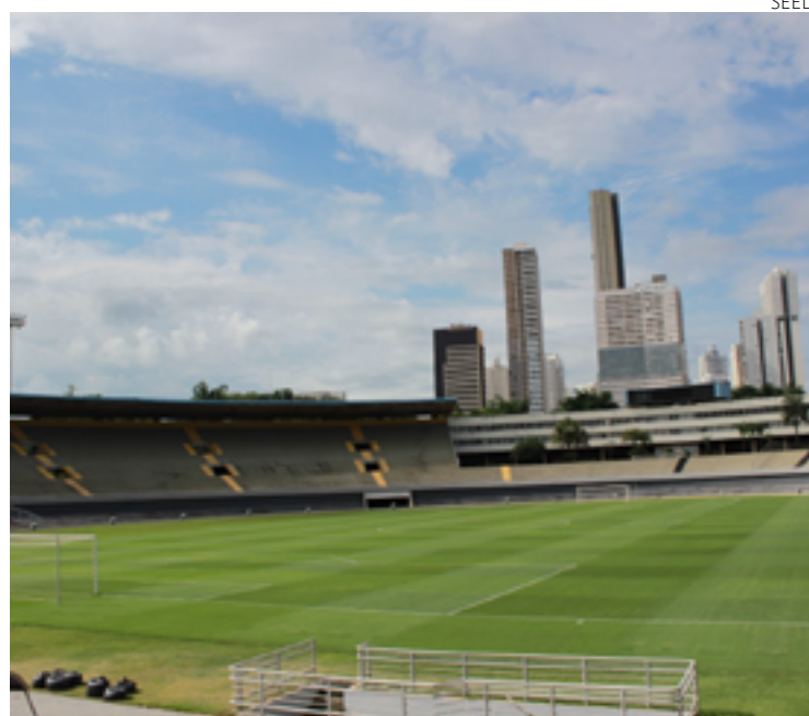
Estádio Serra Dourada: projeto para se transformar em complexo multiuso, com jogos, atividades de lazer e feiras de negócios

O vice-governador e os integrantes do Grupo de Trabalho também elencaram outros quesitos que os grupos empresariais precisariam levar em conta, como mobilidade urbana e a construção de uma via ampla e arborizada, conhecida como "boulevard"; e de