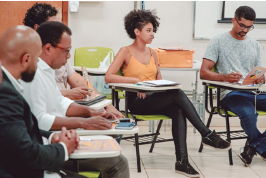
A questão da cor ou raça no Censo é autodeclarada, ou seja, os próprios entrevistados definem sua categoria

BRASIL O número de pessoas pardas no Brasil superou o de brancas pela primeira vez desde 1872. No ano passado, 92,1 milhões de pessoas se reconheciam pardas, enquanto 88,3 milhões, brancas. Entre os recenseamentos de 2010 e 2022, a população branca caiu de 47,7% para 43,5%, deixando de ser majoritária. Por outro lado, os pardos aumentaram a participação de 43,1% para 45,3%. A população preta saltou de 7,6% para 10,2%. Em 2022 eram 20,7 milhões de pessoas. A raça indígena também aumentou a participação no total de habitantes do país, de 0,4% para 0,6%, alcançando 1,7 milhão. Além da população branca, a amarela também apresentou recuo, de 1,1% para 0,4%, somando 850 mil pessoas.