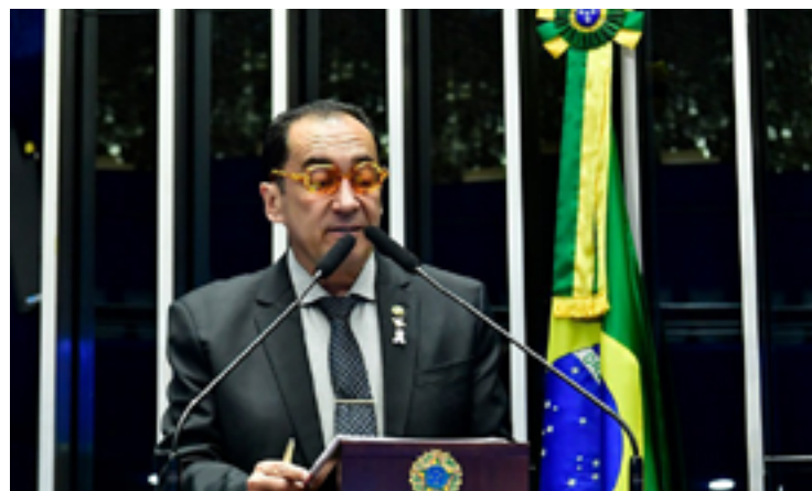
Jorge Kajuru: Lula acerta mais do que erra na gestão